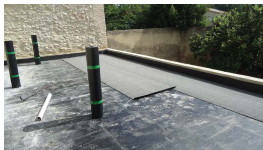
Mise en place d'une 1ere couche d'étanchéité (rouleau d'étanchéité écologique)