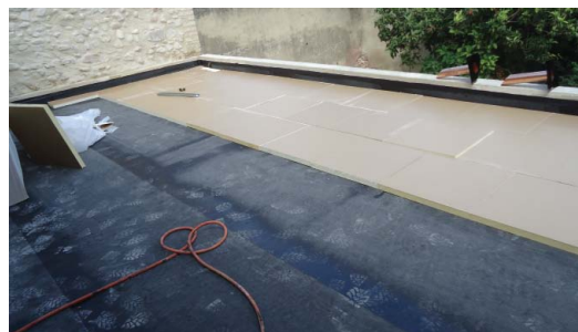
Pose de l'isolant (existe en différentes épaisseurs : 100 mm, 120mm, 140 mm, 160 mm)