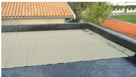
Pose du par vapeur sur le vernis d'impression