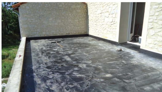
1ere étape : le vernis d'impression