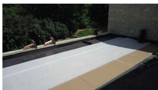
Mise en place du voile écran pour dilatation entre isolant et les laies d'étanchéité