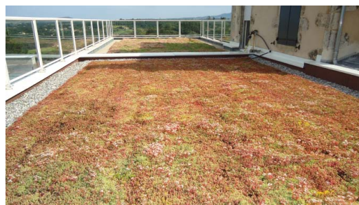
Différentes finitions possibles : dalles sur plot, terrasse bois... ici, terrasse végétalisée