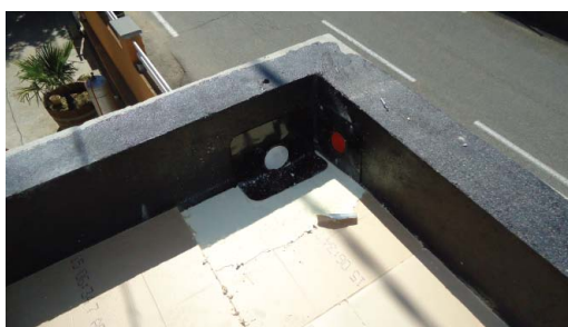
Mise en place des évacuations (plomb pour évacuation d'eau pluviale)