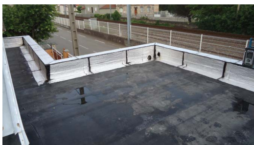
Finitions relevés d'étanchéité